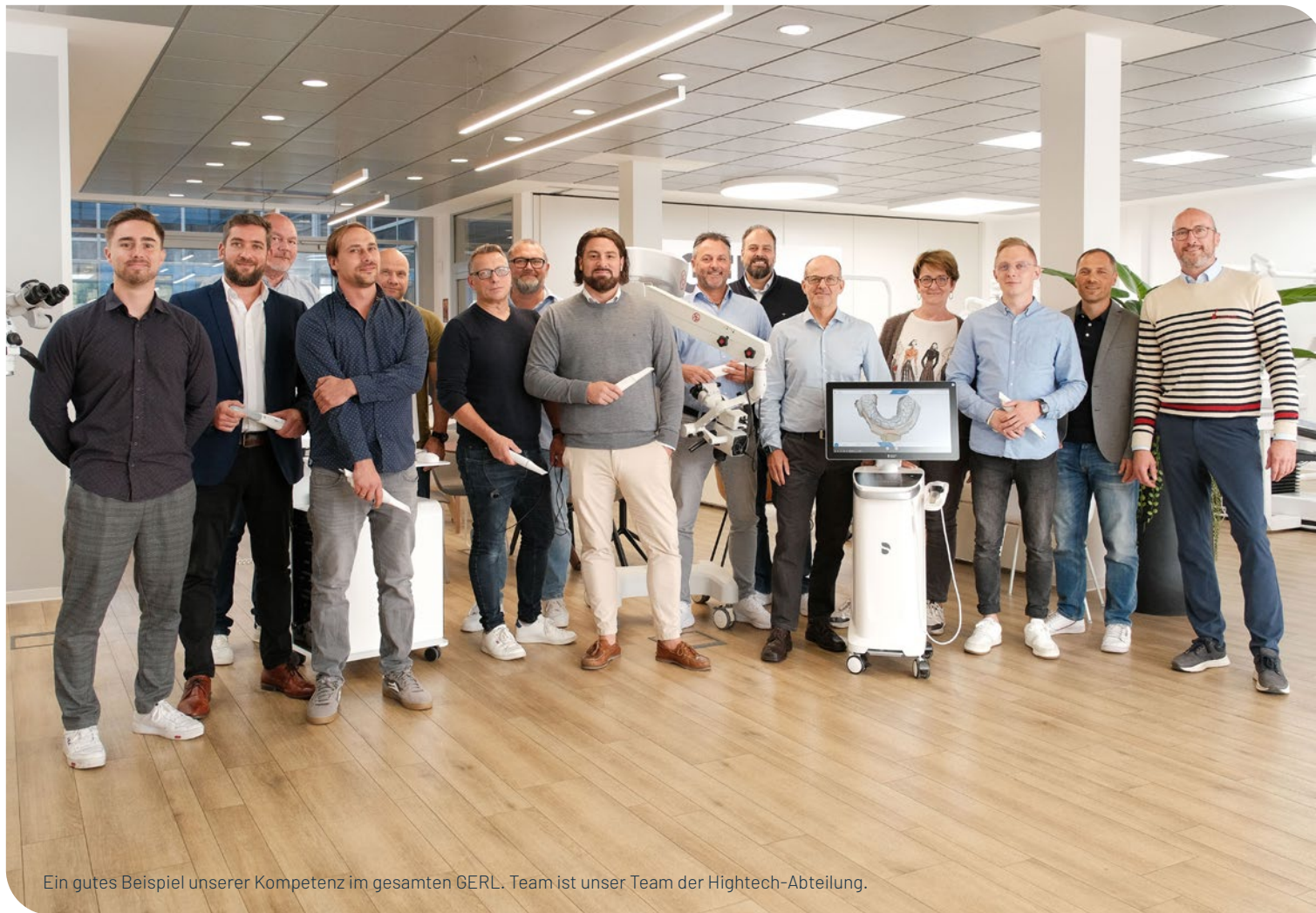
Ein gutes Beispiel unserer Kompetenz im gesamten GERL. Team ist unser Team der Hightech-Abteilung.